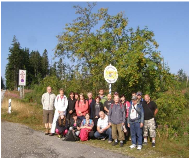
Hasiči na hranicích s Německem

Dne 10. 8. 2013 se Sbor dobrovolných hasičů Lomecka Libějovice vydal poznávat krásy Šumavy. Počasí jim přálo a tak se někteří z nich vydali i za hranice do Německa na rozhlednu v korunách stromů. Většina, ale dala přednost krásám české Šumavy a navštívila vyhlídku Černá hora a Pramen Vltavy. Všichni se nakonec sešli ve skvělé náladě v soukromém pivovaru na Kvildě. Děkujeme všem organizátorům za krásný den na Šumavě.